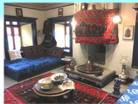
ヴラーフの伝統的な家 (メツォヴォ)